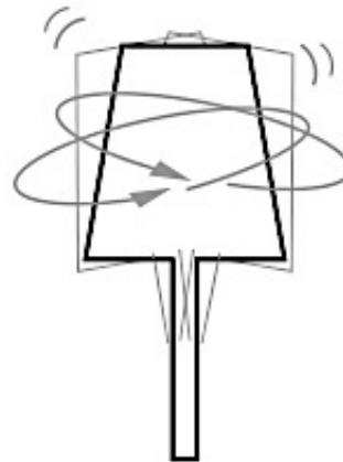
2. クリティカルポイント 歳差運動が始まる